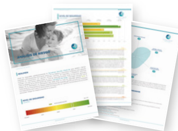
Diagnóstico personal de riesgos