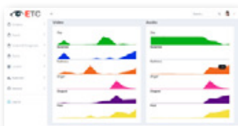
Test de honestidad

Identificación de vulnerabilidades y selección de una solución óptima.